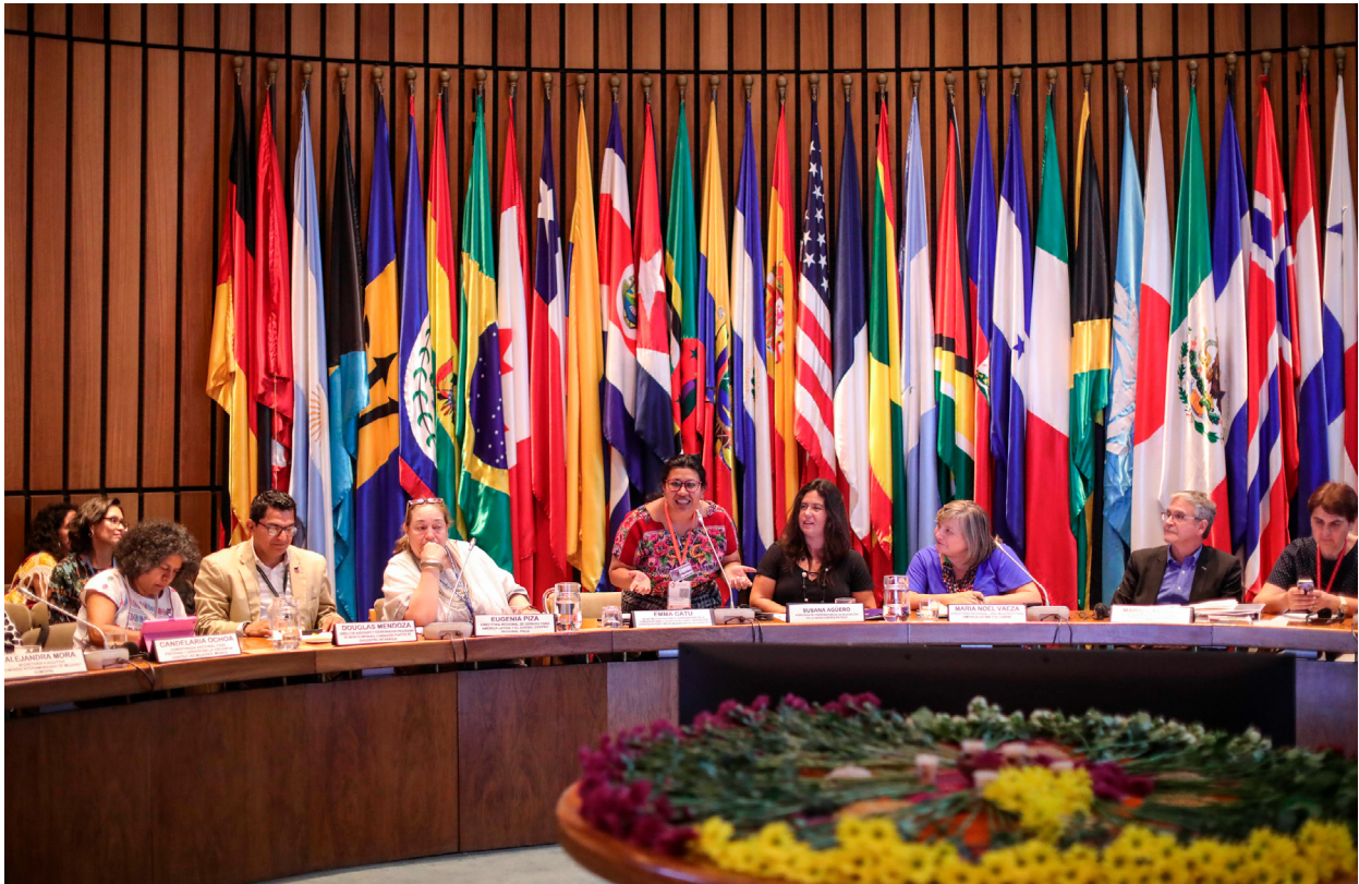
Programa Regional Spotlight América Latina. UN Women Americas and the Caribbean