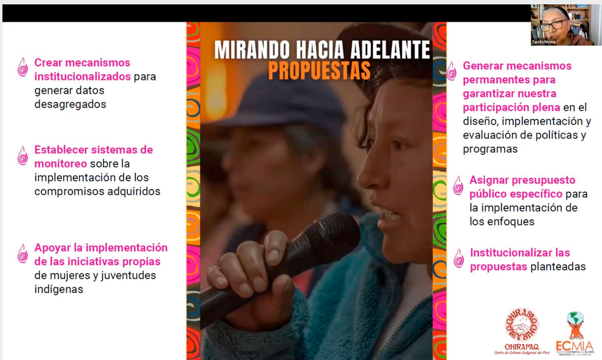
Una Mirada Interseccional en Políticas para la Eliminación de la Violencia Contra Mujeres y Niñas, Ciclo de Webinarios de Cierre, 2023