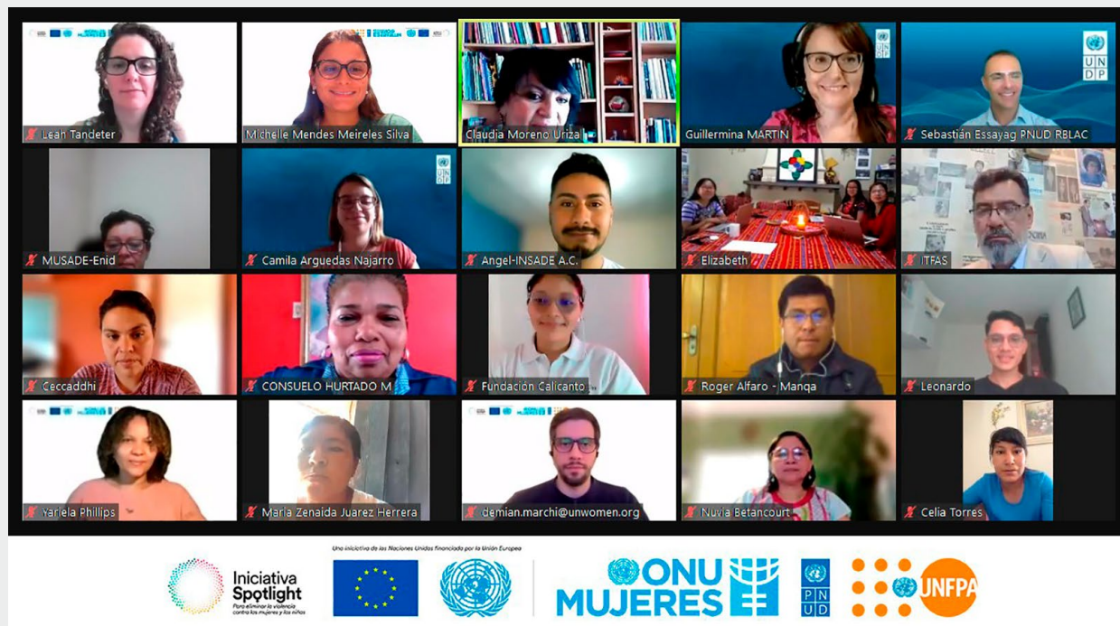
Reunión con las OSC que formaron parte del proyecto de Pequeñas Subvenciones, 2023