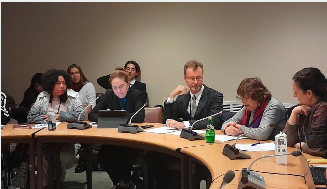
El aporte innovador de la Iniciativa Spotlight en América Latina para eliminar la violencia contra mujeres y niñas, CSW67, Nueva York, 2023