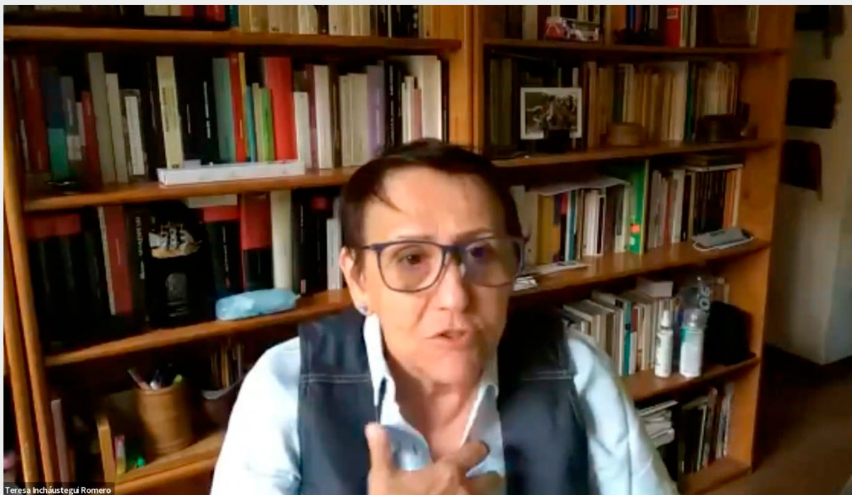
Institucionalización de los Resultados para la Eliminación de la Violencia Contra Mujeres y Niñas, Ciclo de Webinarios de Cierre, 2023