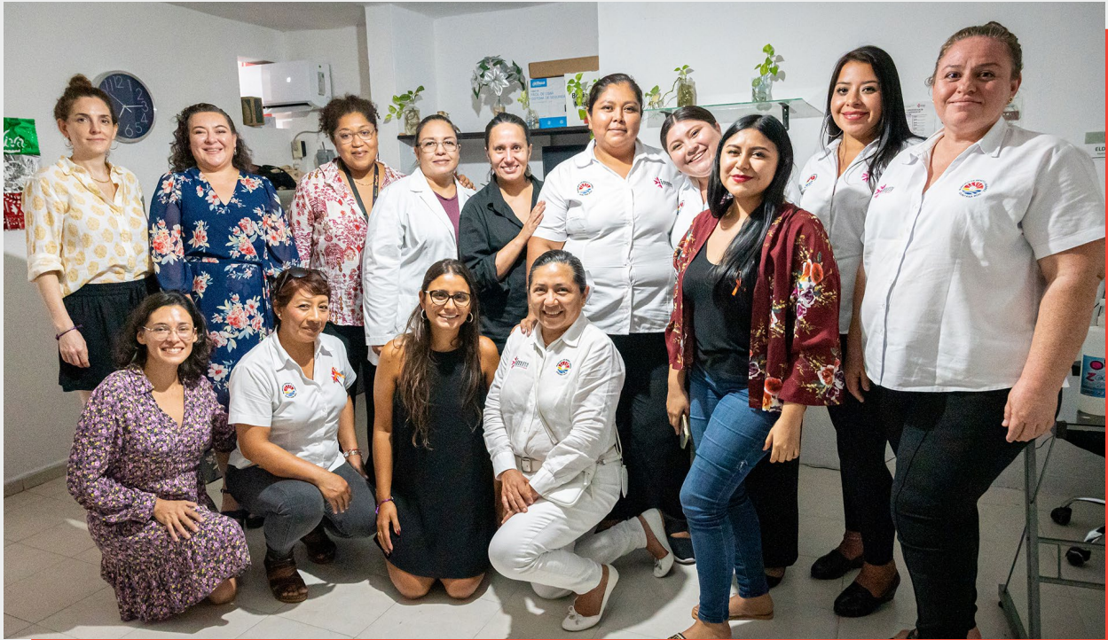
Visita del equipo del Programa Regional al Punto Morado , Módulo de Atención a la VBG, Cancún, México, 2022