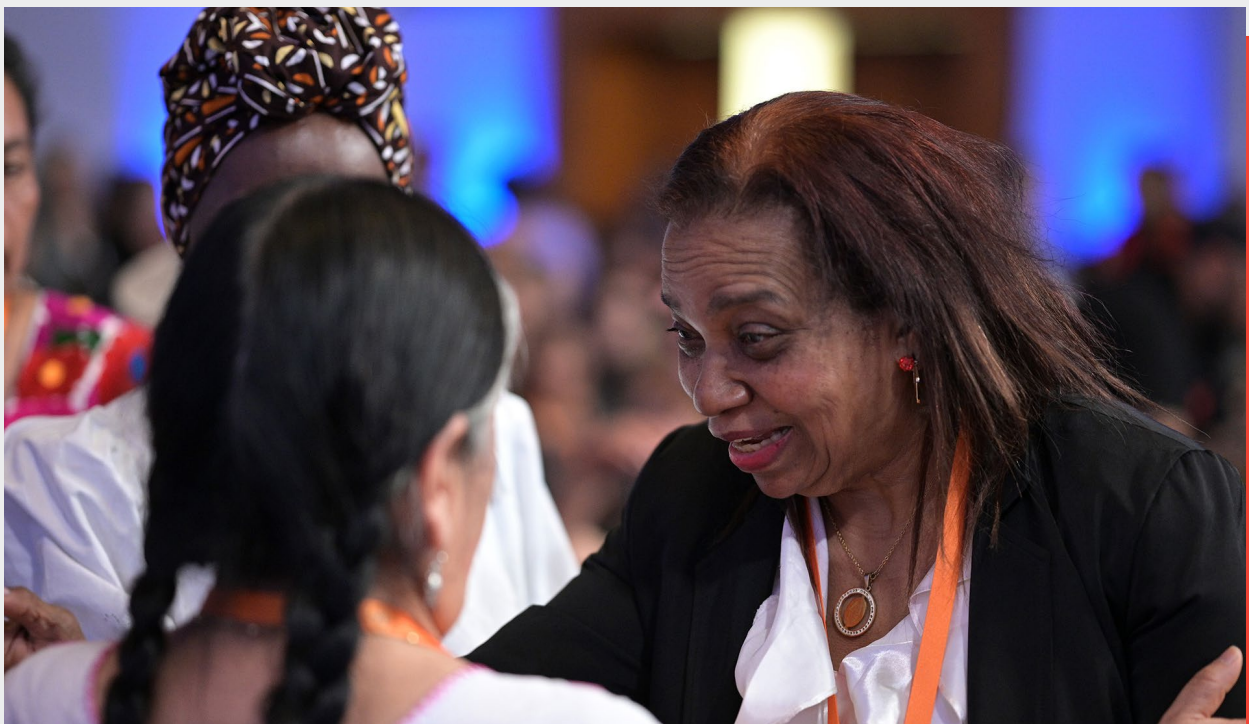
El GRSC participa de la Conferencia Regional de la Mujer, Buenos Aires, Argentina noviembre de 2022